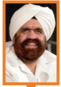
Sant Rajinder Singh Ji Maharaj