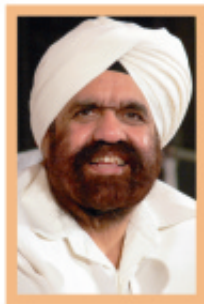
Sant Darshan Singh Ji Maharaj