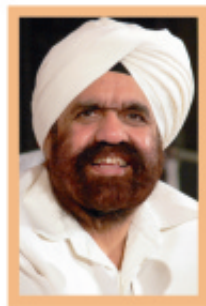
Sant Darshan Singh Ji Maharaj